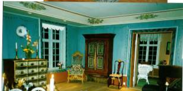
Interiør fra hovedbygningen.