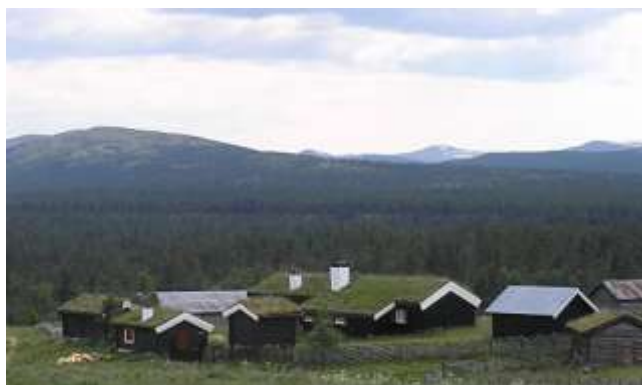
Skjerdingsken seter i Hirkjølen statsalmenning.

På Skjerdingsken i Hirkjølen statsalmenning har gården et større seteranlegg. Seteren ble etablert i slutten av 1600-tallet. Når de enkelte bygningene ble satt opp er ukjent. Seterhuset, med boareale på ca. 129 m 2 , ble fullstendig renoveret og istandsatt for vinterbruk i midten av 1960-årene, med innlagt borevann, avløp og strøm. Bygningene ellers er en vinterstue, en gammel stall ombygd til sovehus, fjøs, stabbur, vedskjul og en større frittstående løe.